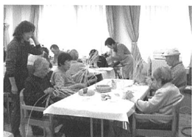
▲火曜日のいなぎ苑での活動風景

会の設立は1998年3月、染色クラブとして発足。2000年10月、NPO法人を取得し、現在会員は34名。手工芸を通して人と人との交流を大事に育てていくことを目的に活動をしていきます。市内外の老人ホーム(月21回)や小学校や子ども会(月1回)へのクラフト講師派遣事業、ボランティア養成事業、子供向けの体験講座開催、研修会(月1回)など、幅広い活動と