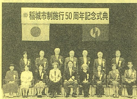
稲城市制施行 50 周年記念式典