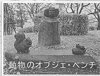
動物のオブジェ・ベンチ