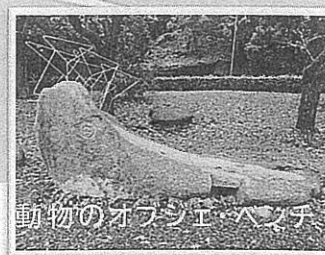
動物のオブジェ・ベンチ