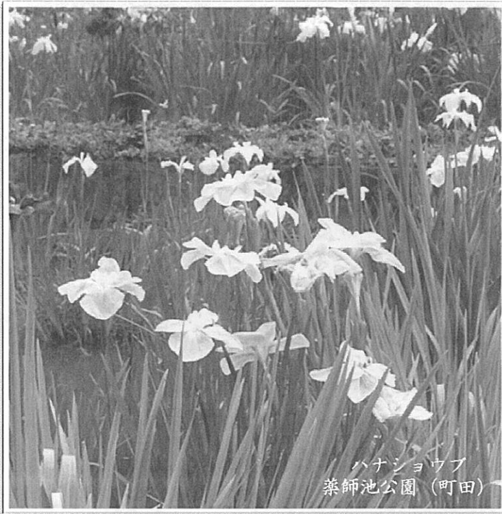
ハナショウブ 蒸師池公園 (町田)

TEL 042-378-8757 (月～金 10時～18時) FAX 042-379-1234 ☒ http://blog.canpan.info/sasaeaukai/ ☒ minorii1973@energy.ocn.ne.jp