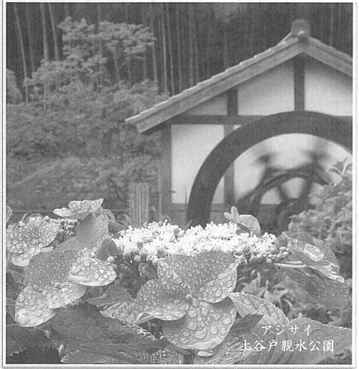
アジサイ 上谷戸親水公園