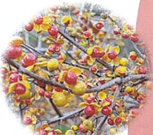
ツルウメモドキ (蔓梅擬)